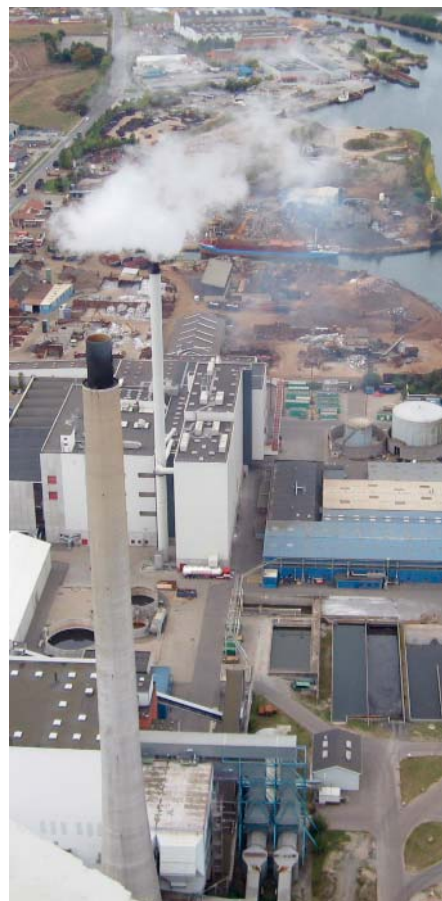
Bland andet her fra Fynsværkets top udbredes Taxa Fyns Tetra-kommunikation med koncernens vognpark.