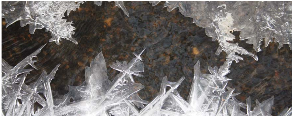
Vinteren har bidt sig fast, og her rækker kæmpestore isblomster ud efter hinanden i forsøg på at lukke isen på Ryds Å.

sit værd under den finansielle krise, den har medvirket til en sikker kurs igennem finanskrisen og nu på vej ud af finanskrisen. Brug denne stærke organisation, den er til gavn og glæde for alle medlemmerne.